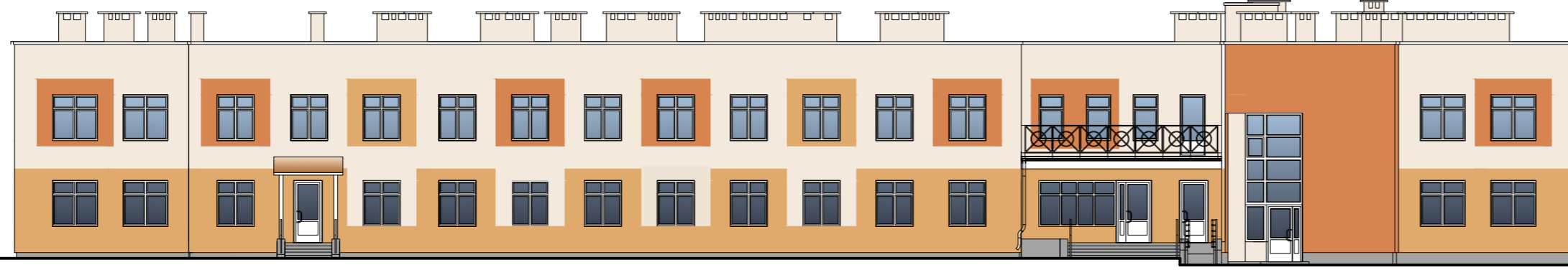
Фасад в осях "1-11"