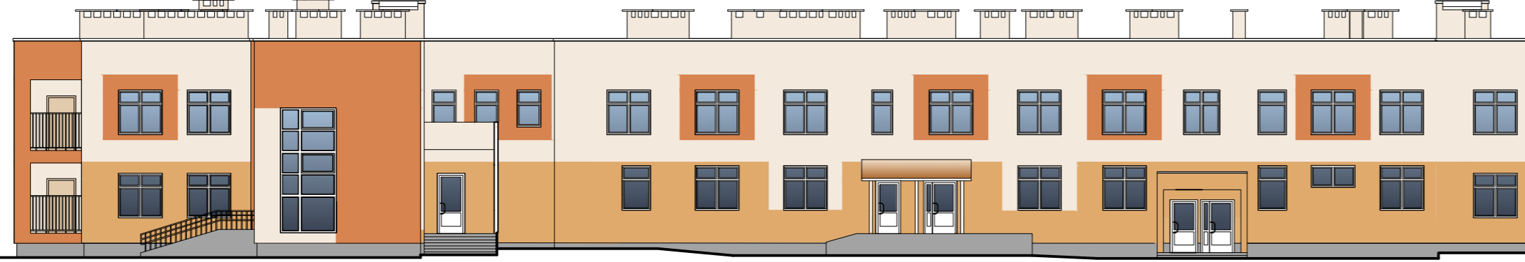
Фасад в осях "11-1"