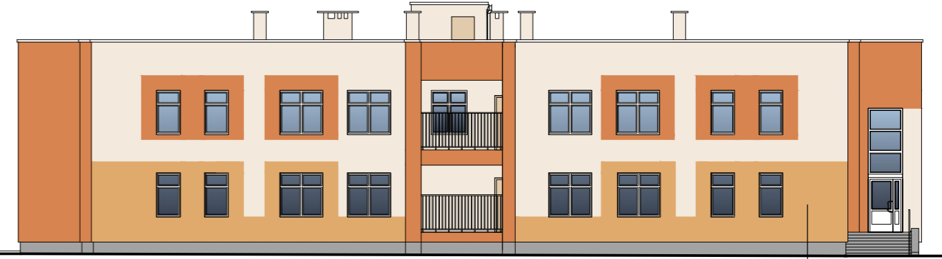
Фасад в осях "А-Н"