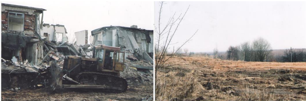
Захоронение д. Кульшичи, 2006 г.

КУРГАНЬЕ – бывшая деревня в бывшем Кульшичском с/с, в 12 км на запад от Славгорода, 82 км от Могилева, 48 км от ж.д. ст. Быхов на линии Могилев-Жлобин. Рельеф равнинный, на севере граничит с лесом. На юге проходят мелиоративные каналы, связанные с р. Песчанка (приток р. Сож). Транспортные связи по шоссе Славгород-Никоновичи, которое проходит недалеко от деревни. В 1990 г. 15 хозяйств, 24 жителя. Деревня пострадала от катастрофы на Чернобыльской атомной электростанции.