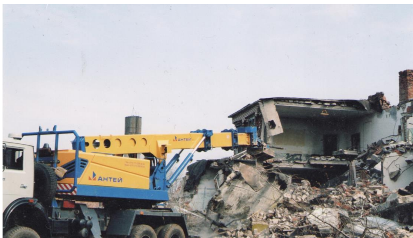
Захоронение д. Старинка 2006 год

На 01.01.1986 года в деревне проживало 142 семьи, 345 жителей.