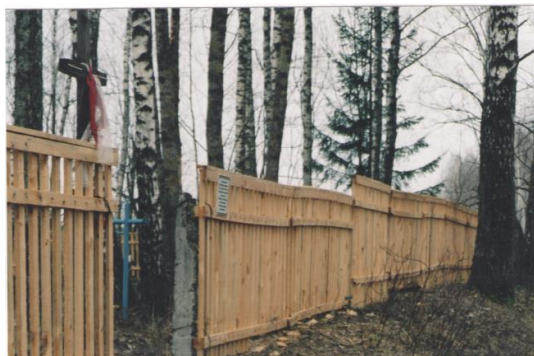
Благоустройство гражданского кладбища д. Красная Слобода, 2005 г.

КРАСНАЯ СЛОБОДА – бывшая деревня в Лопатичском с/с, 10 км на север от Славгорода, 60 км от Могилева, 30 км от ж.д. ст. Чаусы на линии Могилев-Кричев. Рельеф равнинный. На востоке течет р. Проня (приток р. Сож). Транспортные связи осуществлялись по шоссе Могилев-Славгород, проходившему вблизи деревни. В 1990 г. 69 хозяйств, 167 жителей. Деревня пострадала от катастрофы на Чернобыльской атомной электростанции.